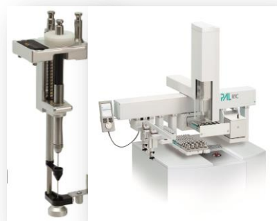
SPME Tool beim RSI und RTC PAL