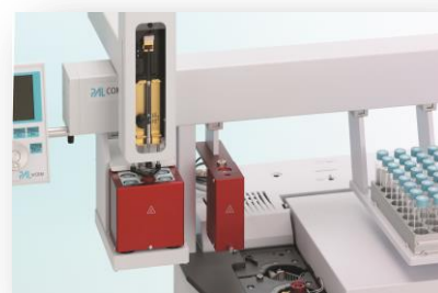
Für alle CTC PAL mit SPME Option